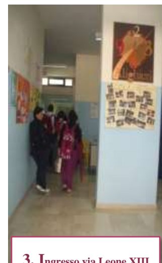
3. Ingresso via Leone XIII (Martucci)

La Scuola è ubicata nel territorio corrispondente alla 6^Circoscrizione della città e comprende una zona centrale, una zona periferica ed una zona limitrofa alla città. Ne fanno parte i quartieri Diaz, Martucci, il Borgo Tavernola, il "Villaggio Artigiani" e diverse zone rurali.