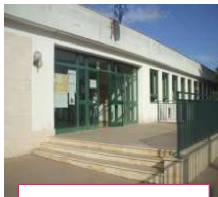
1. Ingresso del plesso Rione Diaz (Cartiera)